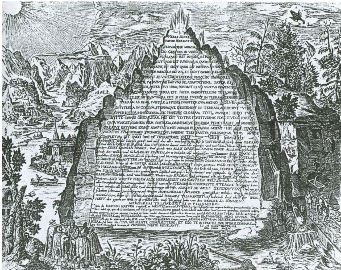
Science et tradition hermétique. Par Frances A. Yates. Éditions Allia. 96 pages. 6 euros 50