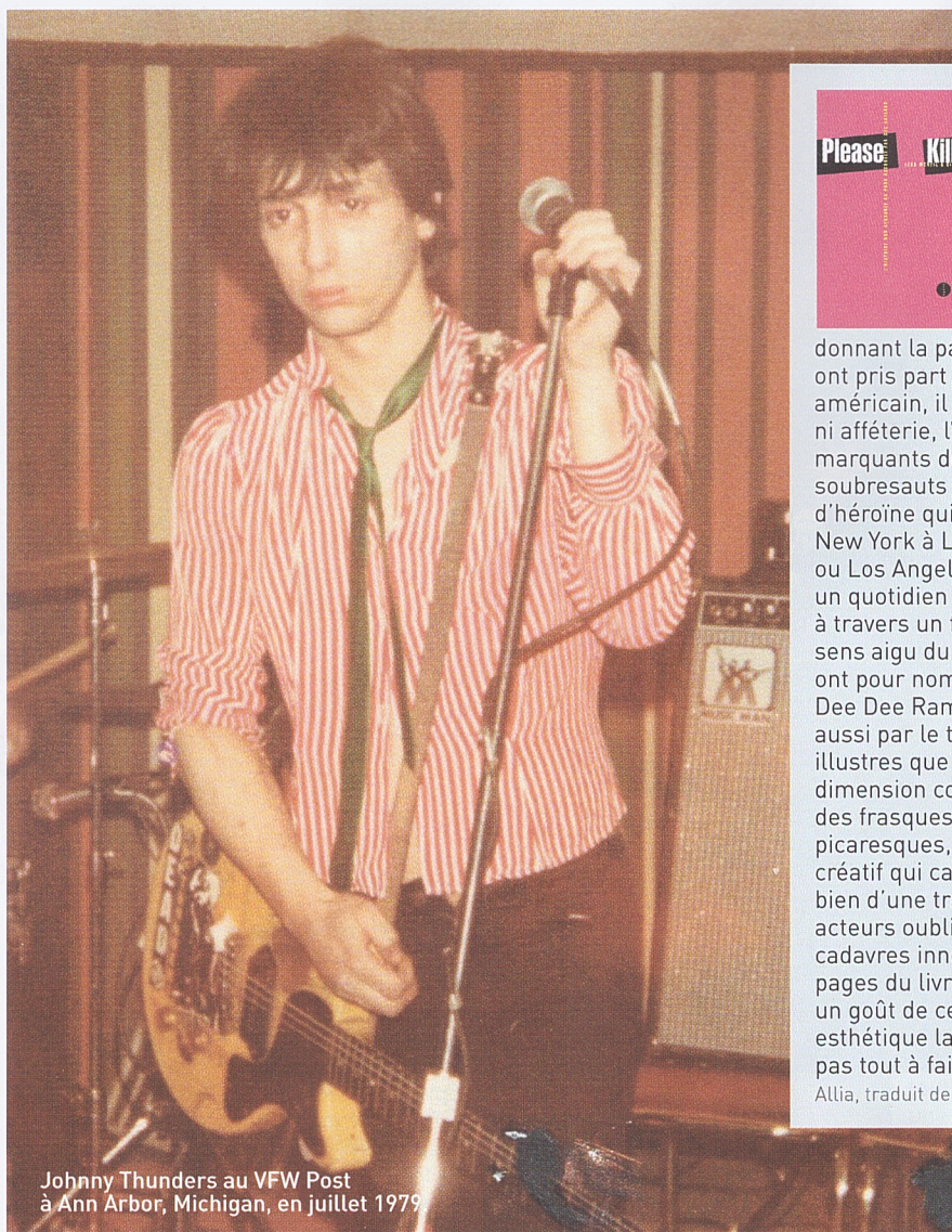
Johnny Thunders au VFW Post à Ann Arbor, Michigan, en juillet 1979