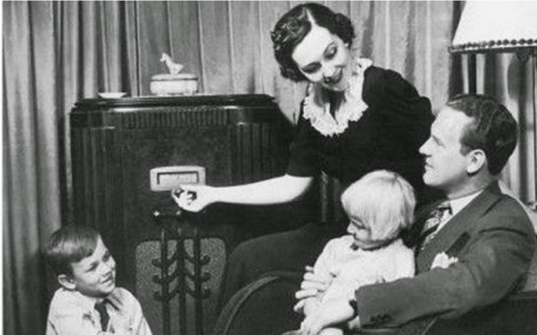
Date et auteur non identifiés

Benjamin, le philosophe au pays des voix