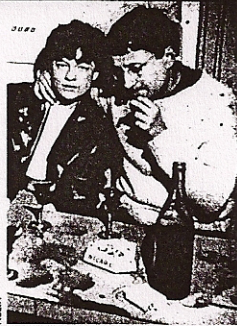
En haut, Johnny Rotten, leader des Sex Pistols. Au centre, le « situ » Guy Debord. A droite, Little wop bop a loo bop a lop bam boom Richard.