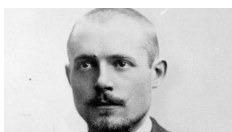
Jean Onimus : se faire l'apôtre du poétique