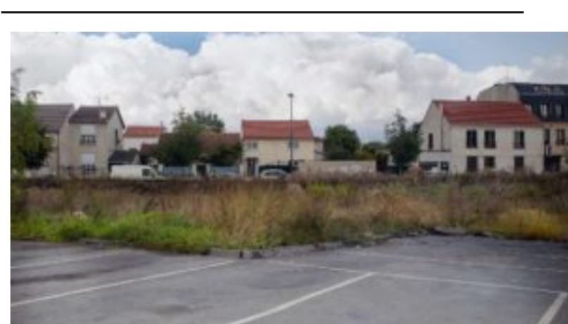
Le toponyme et le territoire