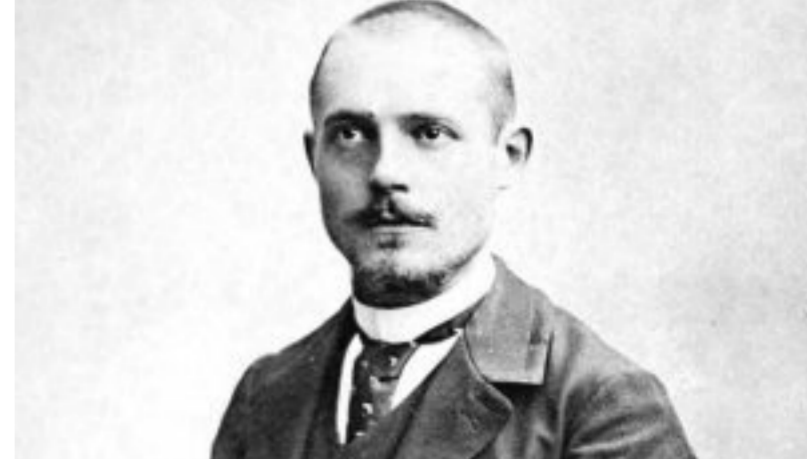
Année Zéro : Charles Péguy