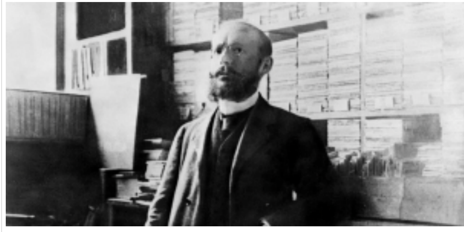
Charles Péguy, auteur de L'Argent , dans les bureaux des Cahiers de la Quinzaine, 1913.

Posted by Charles Mouliès on lundi, décembre 25, 2023 · Leave a Comment