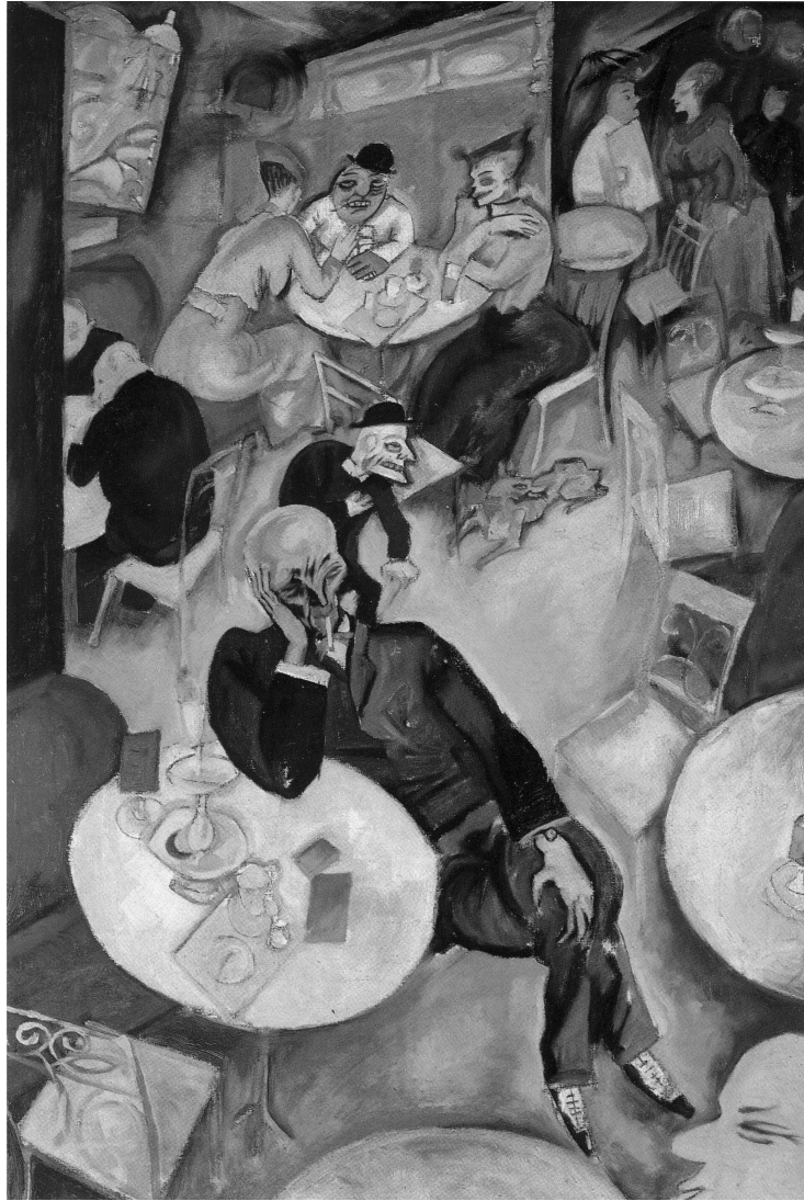
Café, 1916, huile sur toile, 48,5 x 33 cm, Saint Louis (MO), The Saint Louis Art Museum.

espace indéfiniment fragmenté, coupant, incompréhensible, qui se dresse à la verticale, laissant suspendus dans le vide des hommes ivres et des filles de joie au visage morne. A d'autres endroits, il semble que des courants souterrains s'appêtent à les aspirer. Grosz voit le décor inchangé de la grande ville avec les yeux de celui qui revient de l'enfer. Mais personne ne semble prêter attention à la mort qui fait sa ronde, squelette parfois, meurtrier livide, corbillard ou chien rouge, le plus souvent. Grosz, lui, sent le sol se dérober sous ses pieds.